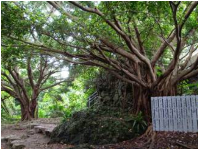
チビチリガマの前にあるガジュマルの木と「チビチリガマのうた」の歌詞の掲示↑