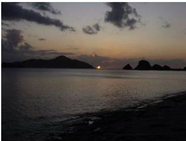
チビチリガマで亡くなった人たちの冥福を祈るポーポキ→