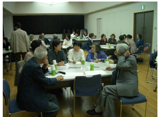
昔の私達の生活は平和？ ↑

皆さんお持ちの特技を、最初は遠慮がちに、だんだん大胆に、ご披露してくださり、笑顔と笑いの絶えない、本当に楽しそうなワークショップになりました。