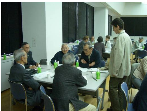
非平和なんか、考えたこと無いなあ ↑

そして作業が始まると、男性ばかりで集まっていたグループからは「誰か助けに来てくれー」と言う悲鳴が上がったりもしましたが、そこは人生の達人方。