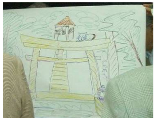
平和の門である鳥居の上にはやっぱりポーポキ ↑