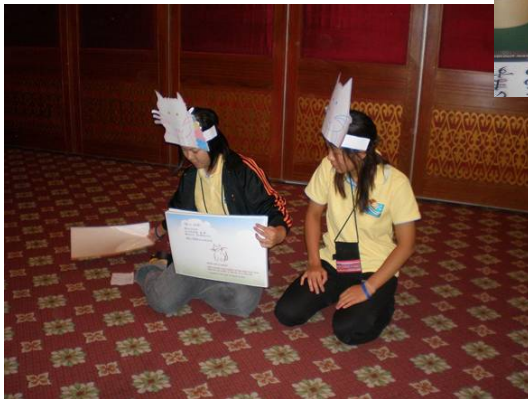
日本 YMCA 同盟が各国同盟に本をプレゼント