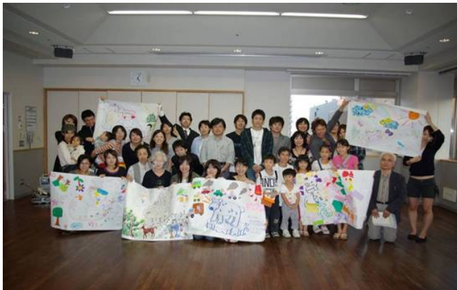
ポーポキ in 新潟! (10.6)