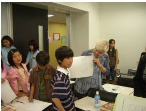
Peace as a Global Language (Imagine Peace) 10.28