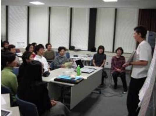
← ポーポキ in 西宮 西宮市国際交流協会 (12.1)