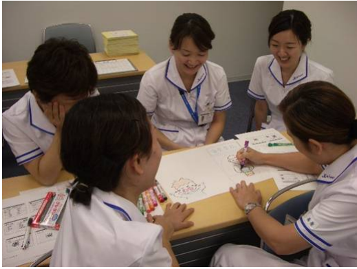
8.31 神戸海星病院でワークショップ