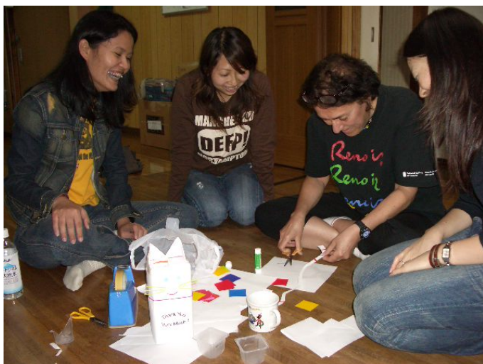
釜ヶ崎で「ポーポキ・募金」をみんなで作成