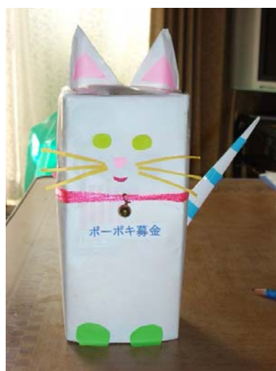
神戸大学に登場したポーポキ募金の募金箱